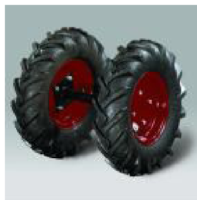
FIX JÁRÓKERÉK PÁR